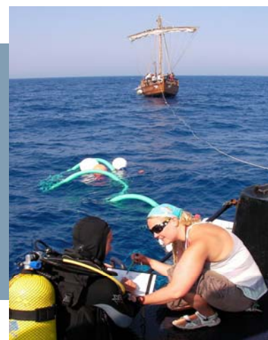
Δεξιά: Επίσκεψη του Κερύνεια – Ελευθερία στο Ναυάγιο του Μαζωτού.