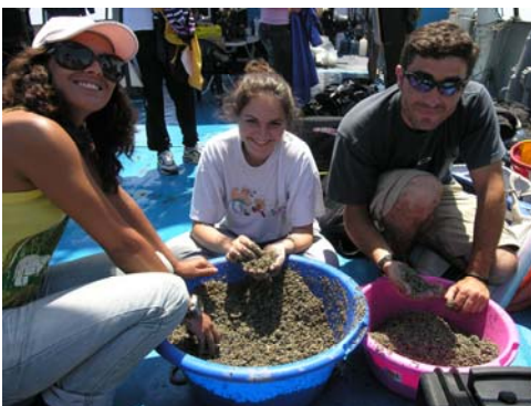
Αριστερά: Διαλογή μικρών ευρημάτων από το περιεχόμενο του αναρροφητήρα.

Μέσα από τη συμμετοχή τους οι φοιτητές είχαν την ευκαιρία να δουν και στην πράξη τις διάφορες πτυχές και ιδιαιτερότητες μιας υποβρύχιας αρχαιολογικής έρευνας που είχαν επισημανθεί κατά τις διαλέξεις: τον τρόπο οργάνωσης και πραγματοποίησης μιας υποβρύχιας ανασκαφής, τις ιδιαιτερότητες των εργασιών στο νερό, τη χρήση των πλωτών μέσων, τη σημασία της χρήσης σύγχρονων τεχνολογικών μέσων και της συνεργασίας διαφορετικών